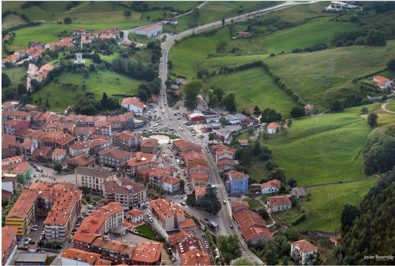
9 - CABEZÓN DE LA SAL 2007 – Zona Centro