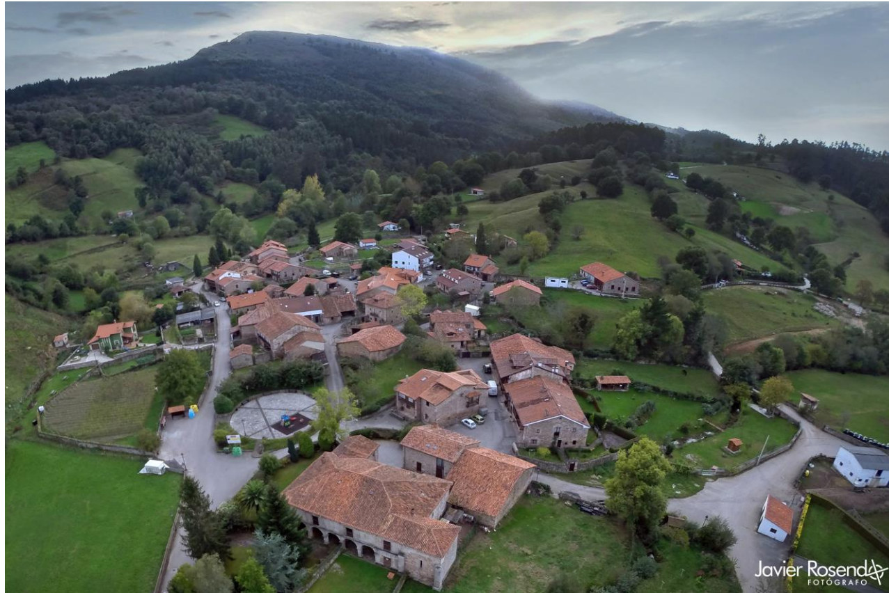
6 - CABEZÓN DE LA SAL 2000 – Santibañez