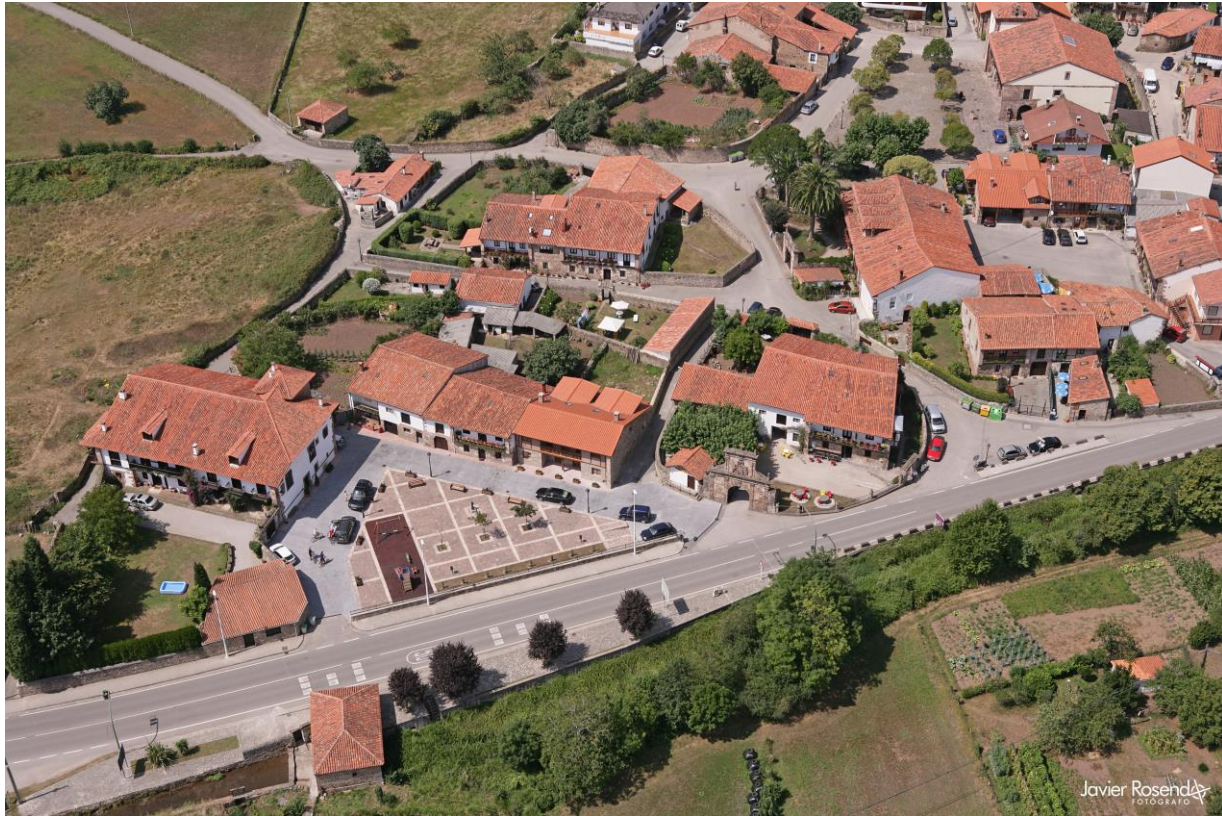
8 - CABEZÓN DE LA SAL 2005 – Carrejo