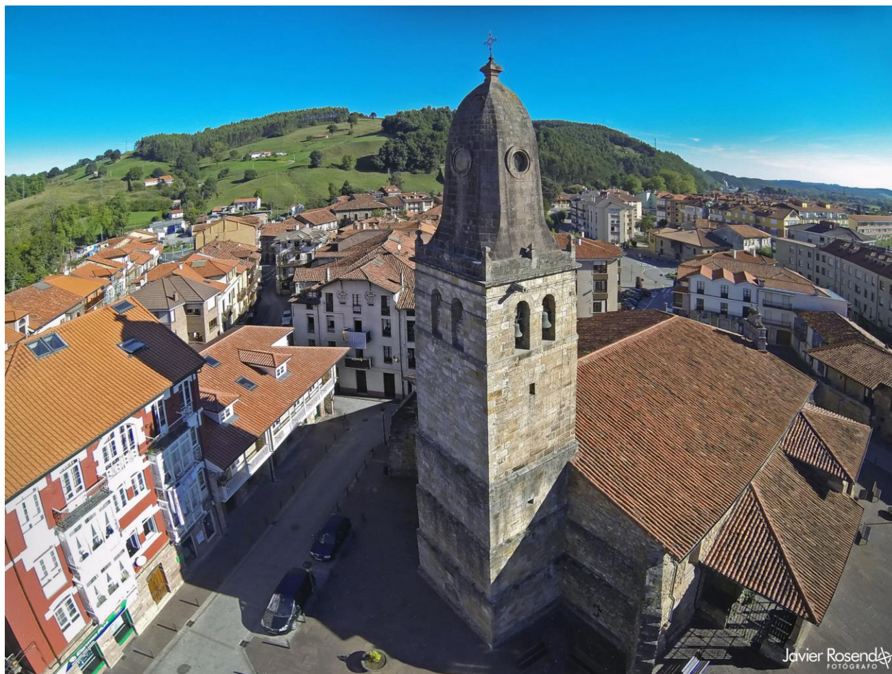
11 – CABEZÓN DE LA SAL 2013 – Iglesia