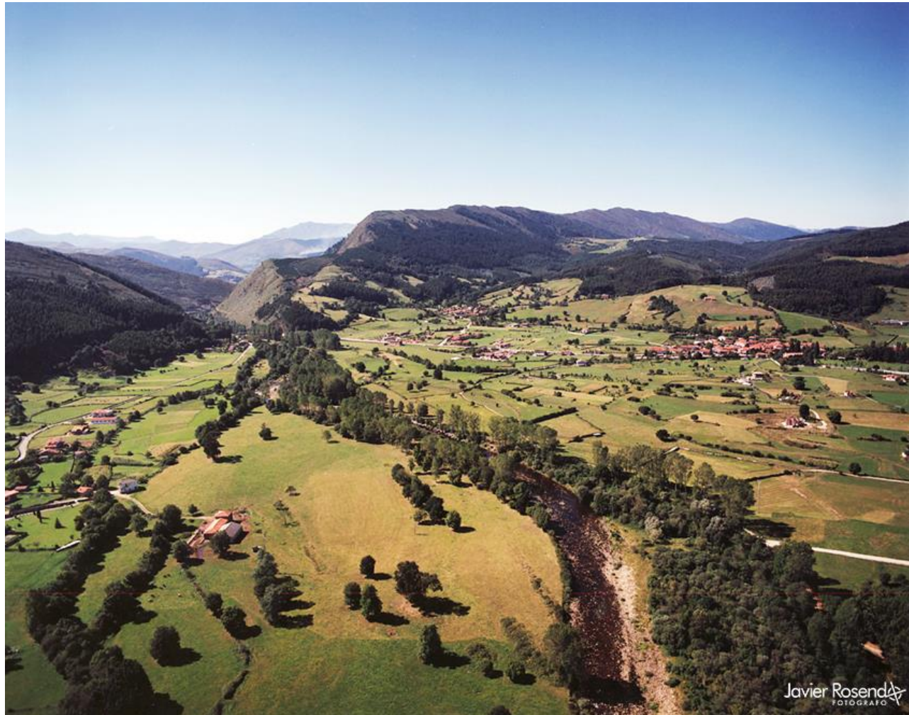
5 - CABEZÓN DE LA SAL 1999 – Carrejo-Santibañez-Santa Lucia