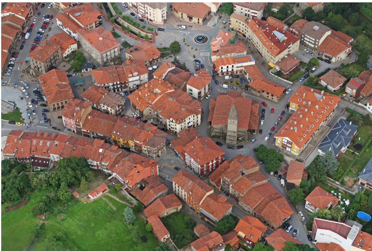
10 - CABEZÓN DE LA SAL 2007 – Zona de la Iglesia