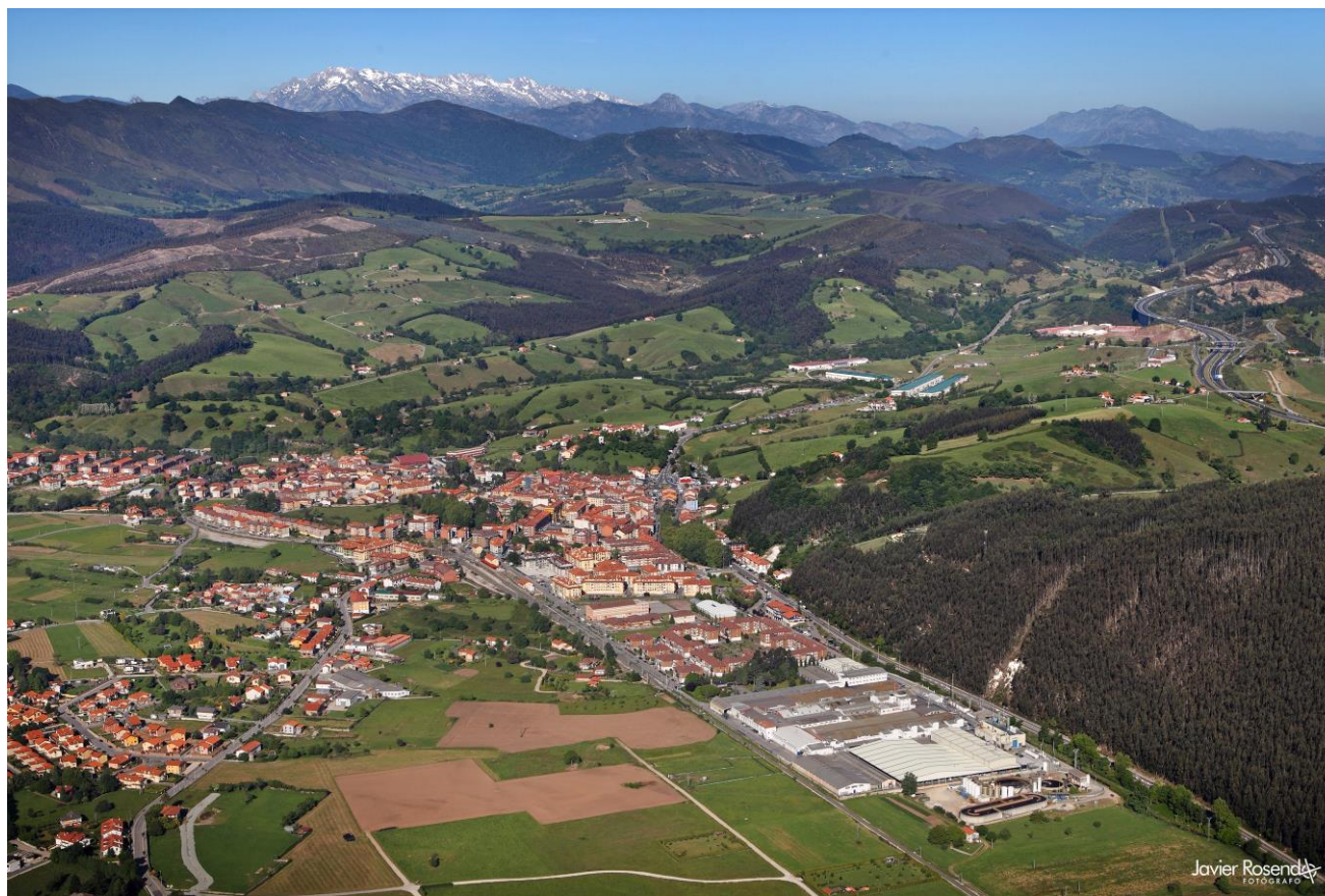
4 - CABEZÓN DE LA SAL 1999 – Vista desde el este