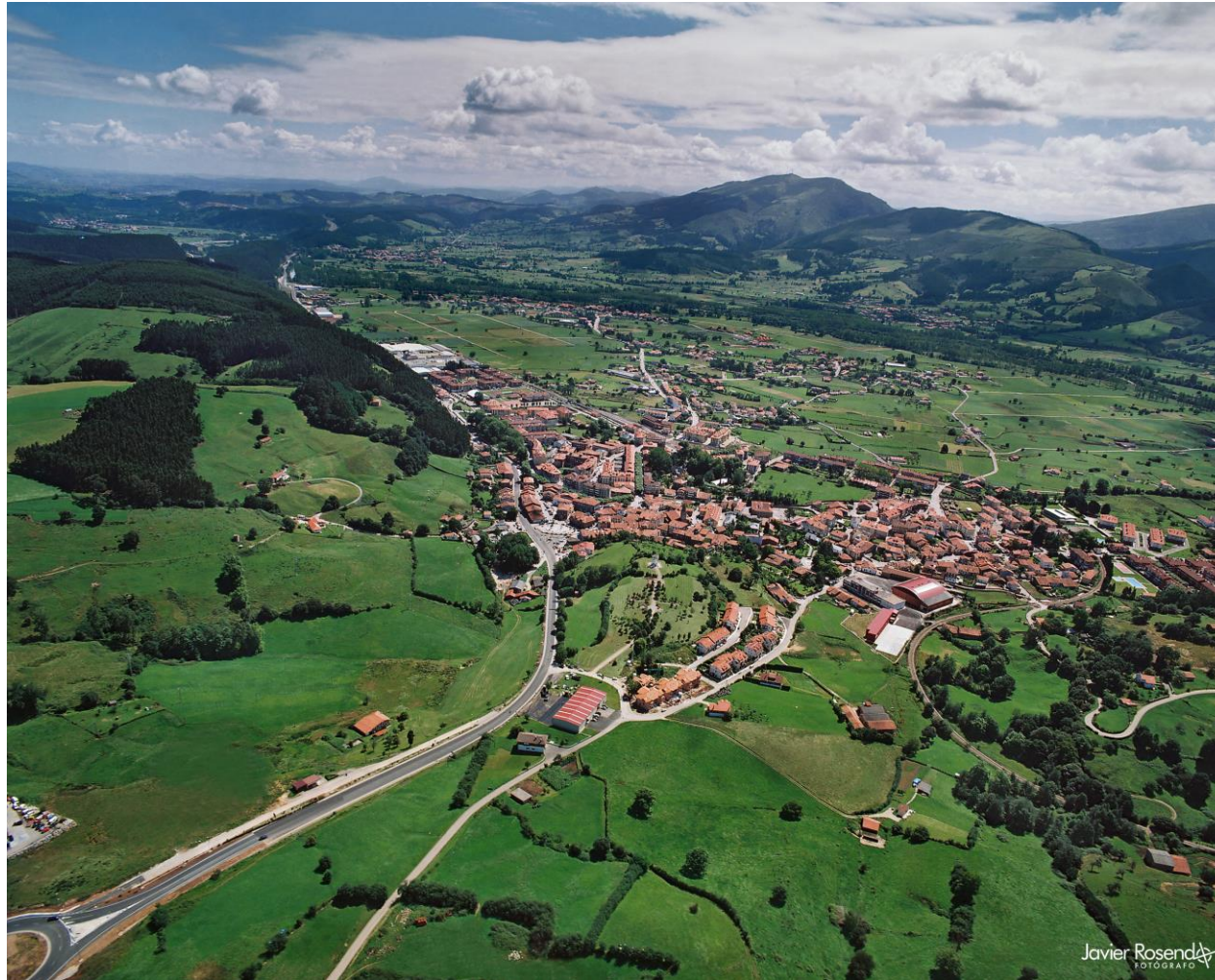
14 - CABEZÓN DE LA SAL 2018 – Vista desde Navas