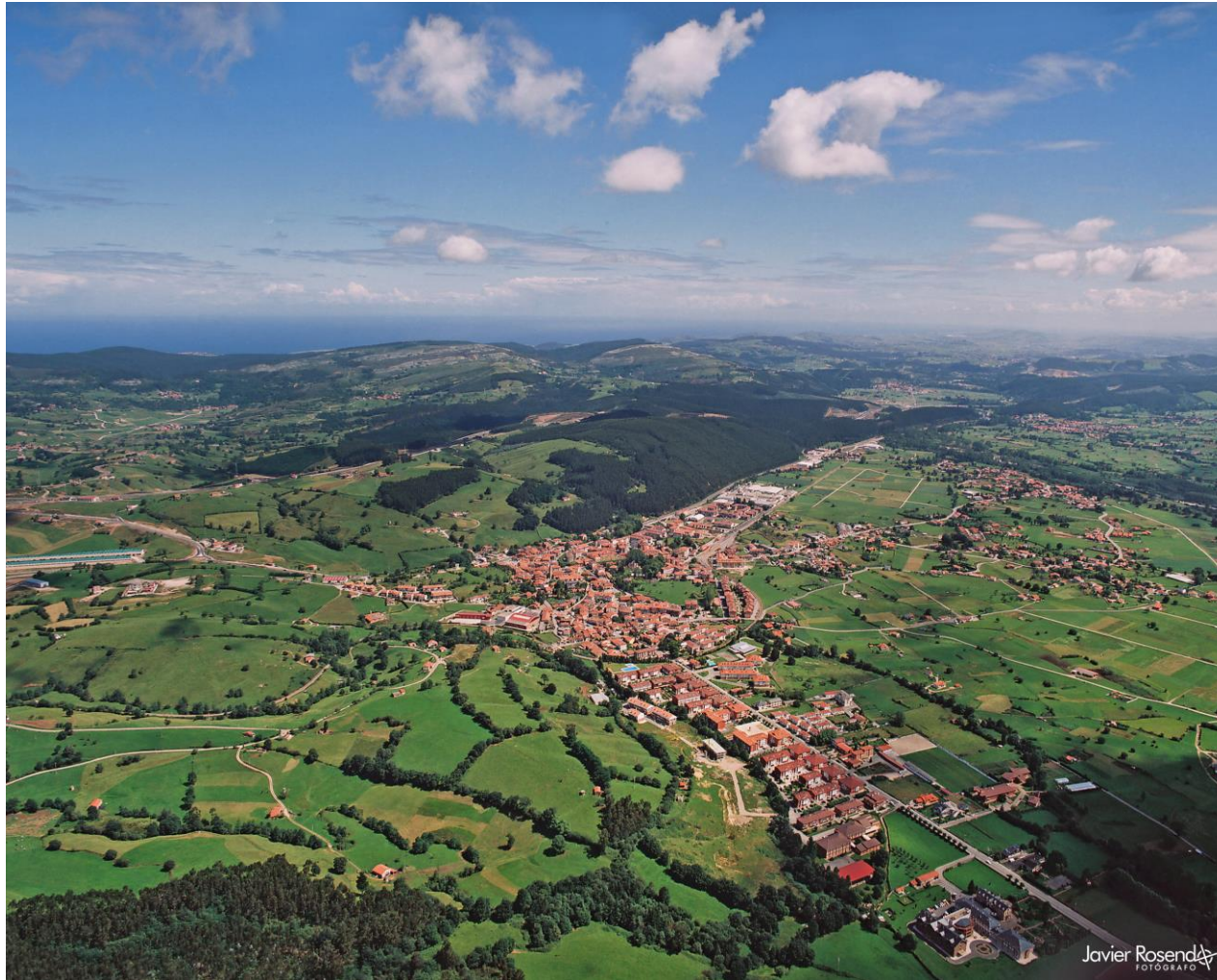
15 - CABEZÓN DE LA SAL 2018 – Vista general