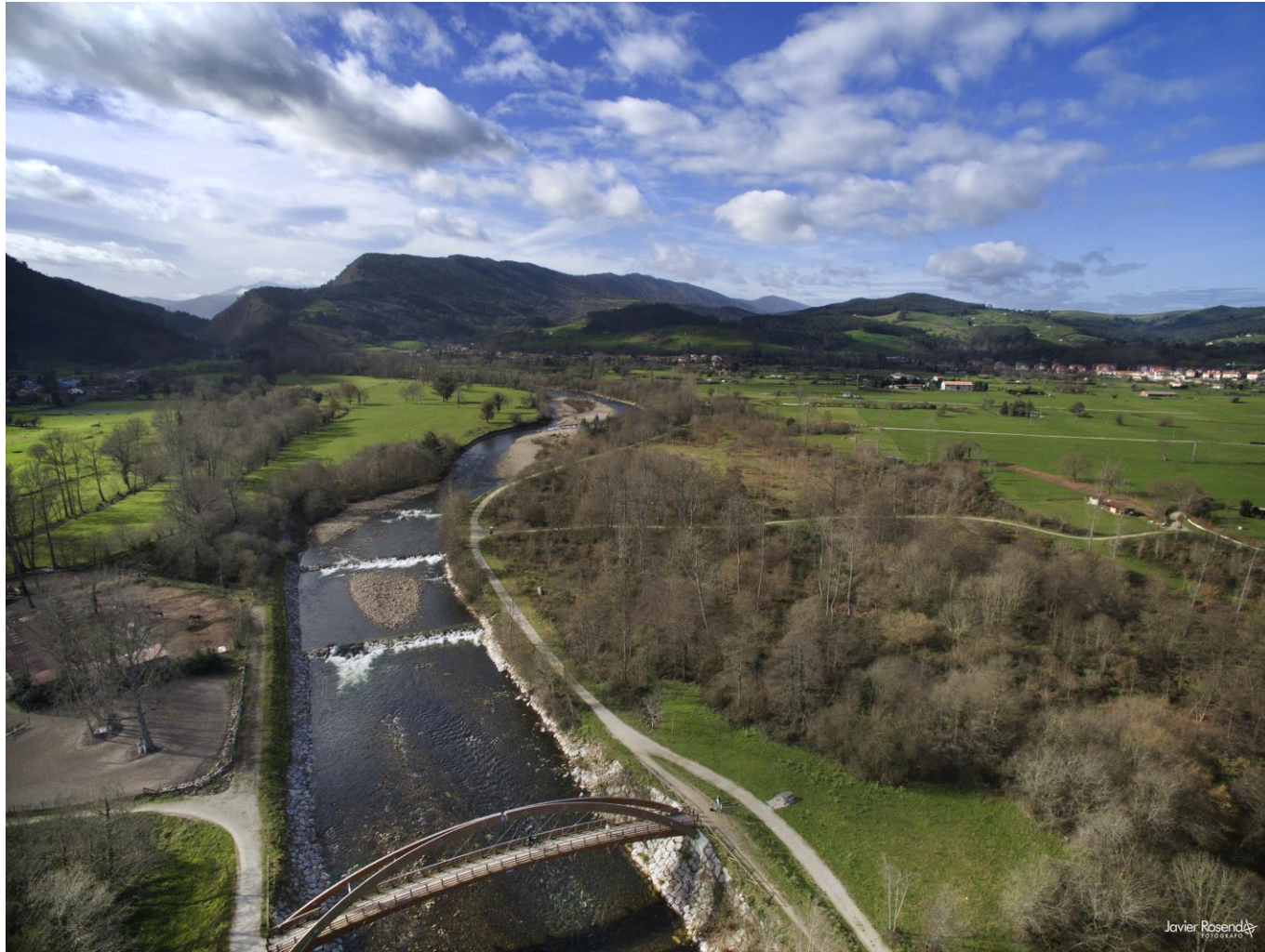
17 - CABEZÓN DE LA SAL 2023 – Rio Saja