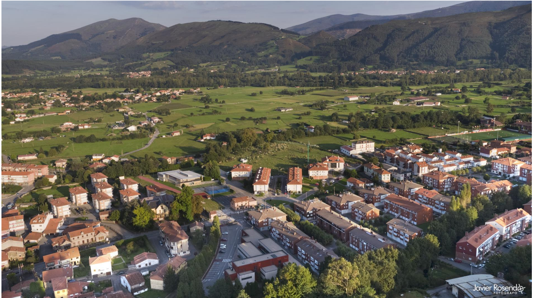
16 - CABEZÓN DE LA SAL 2020 – Zona Domañanes