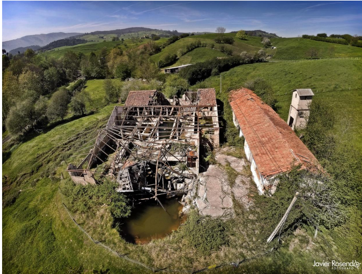
12 – CABEZÓN DE LA SAL 2013 – Pozo de la Sal - Tresano