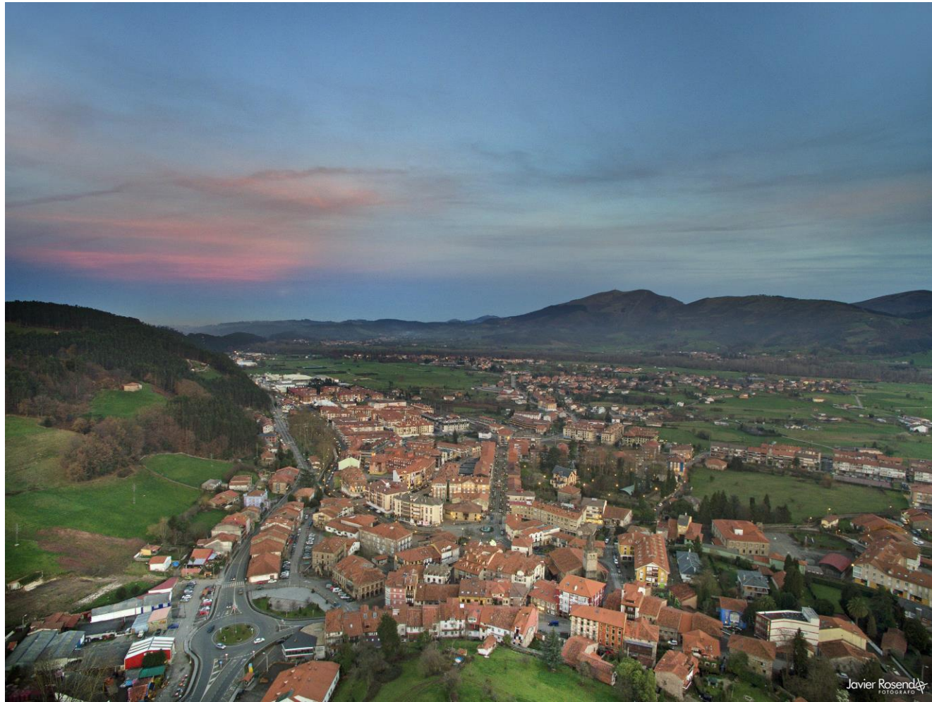
13 - CABEZÓN DE LA SAL 2017 – Vista desde el oeste