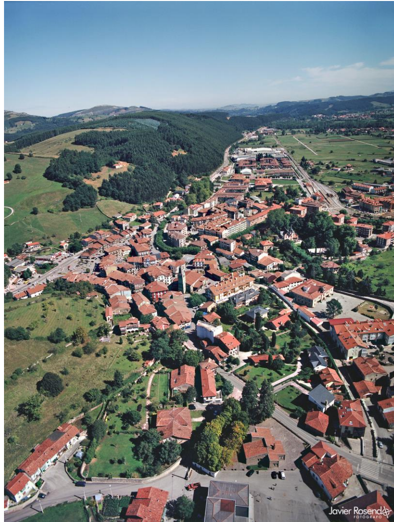
7 - CABEZÓN DE LA SAL 2002 – Vista desde el suroeste