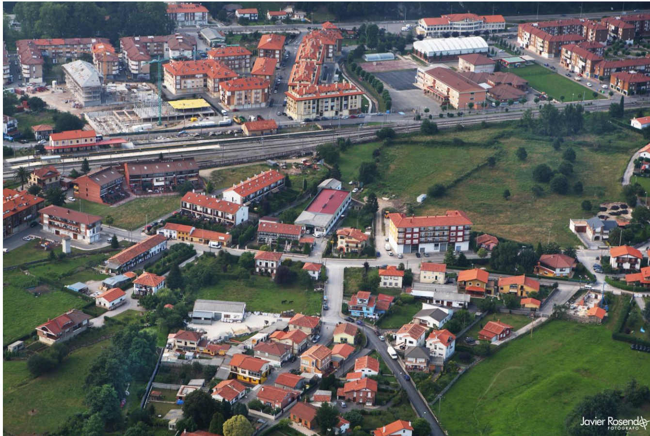
2 - CABEZÓN DE LA SAL 1998 – Barrecabras-La Estación