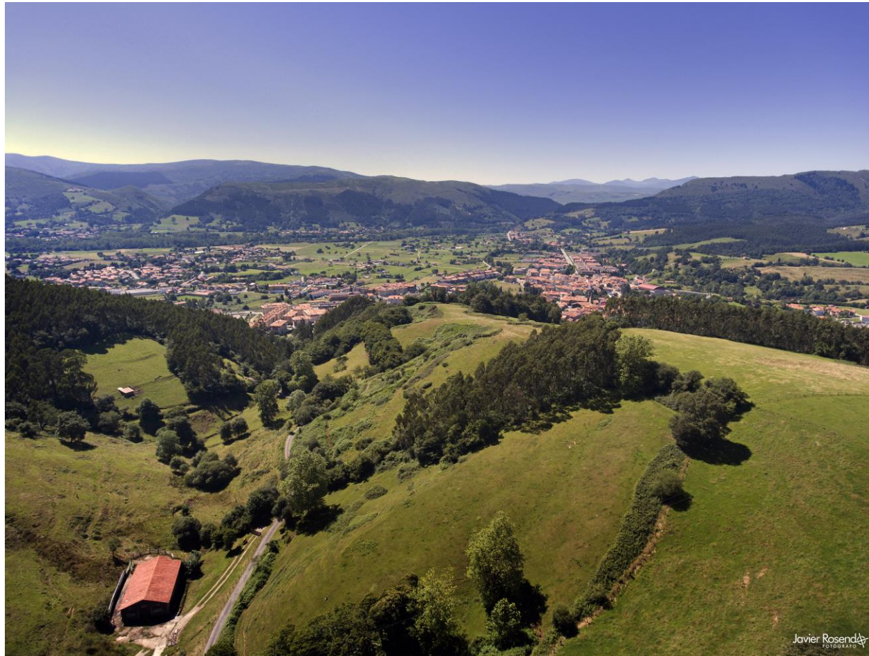
3 - CABEZÓN DE LA SAL 1998 – Desde La Fontanuca